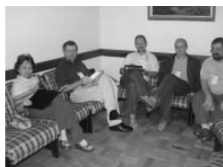
Um dos grupos de trabalho