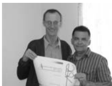
Instituições receberam diplomas de filiação